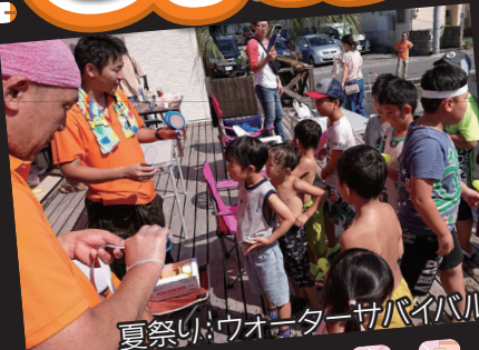
夏祭り:ウォーターサバイバル